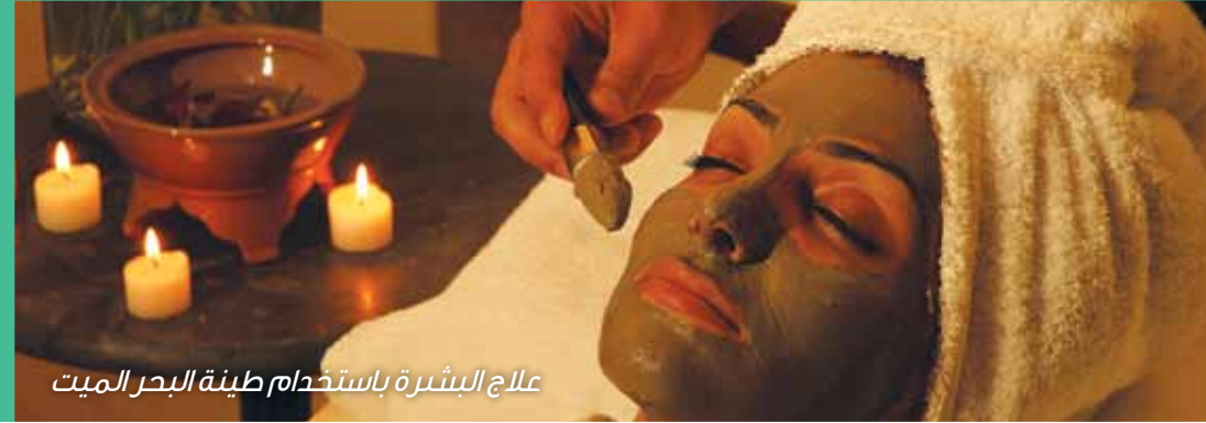
علاج البشرة باستخدام طينة البحر الميت