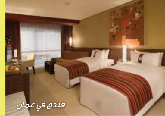
فندق في عمان