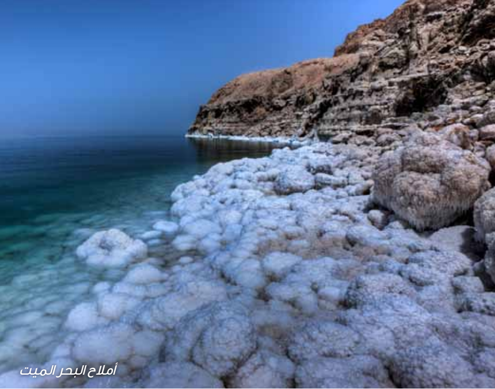
أملاح البحر الميت