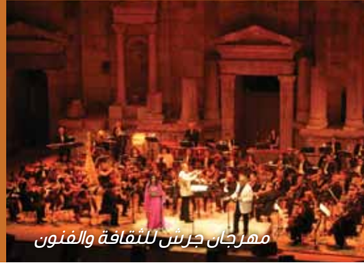
مهرجان جرش للثقافة والفنون