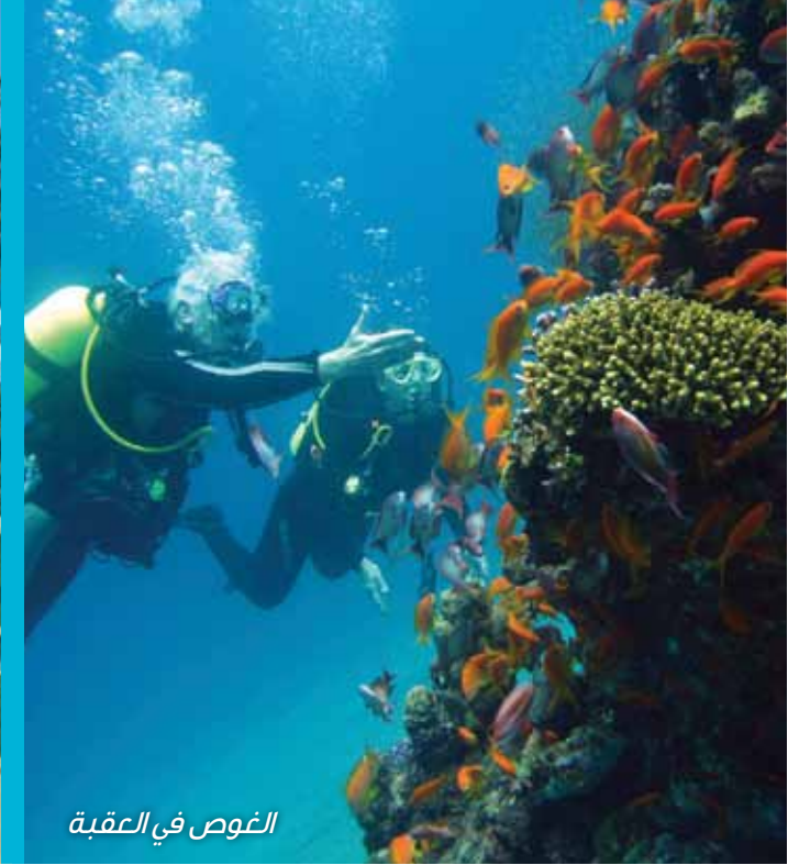
الغوص في العقبة