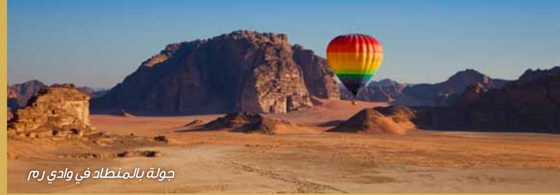
جولة بالمنطاد في وادي رم

وللمزيد من المعلومات يمكنك زيارة الموقع الإلكتروني www.royalaerosports.com