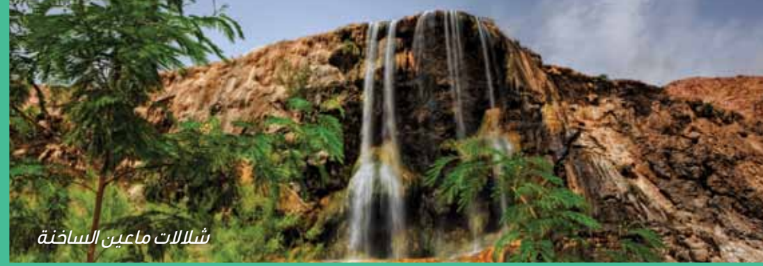
شلالات ماعين الساخنة

تقع الحمة الأردنية على بعد ١٠٠ كم تقريبا الى الشمال من عمان، وهي من أهم مواقع العلاج في المنطقة، حيث تضم مركزاً علاجياً هاماً لعلاج الامراض الصدرية والتهابات الجهاز التنفسي وامراض الجهاز العصبي والامراض الجلدية وأمراض المفاصل، وقد اقيم فيها منتجع يقدم كافة الخدمات السياحية والعلاجية للزائر.