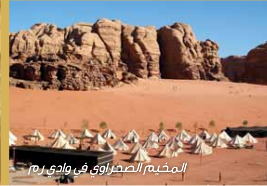
المخيم الصحراوي في وادي رم