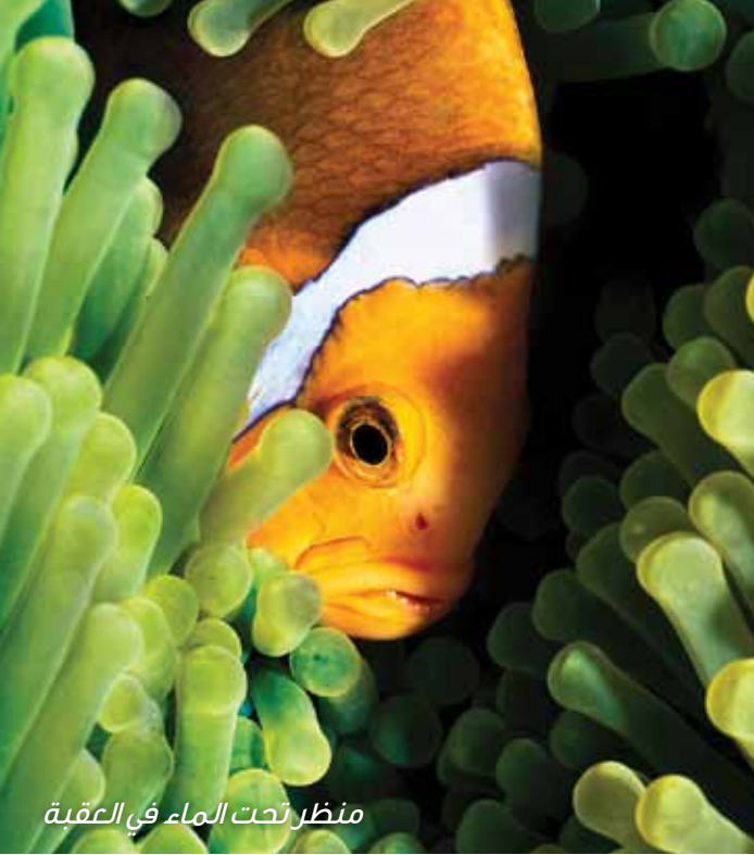
منظر تحت الماء في العقبة