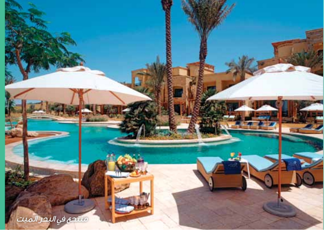
منتجع في البحر الميت