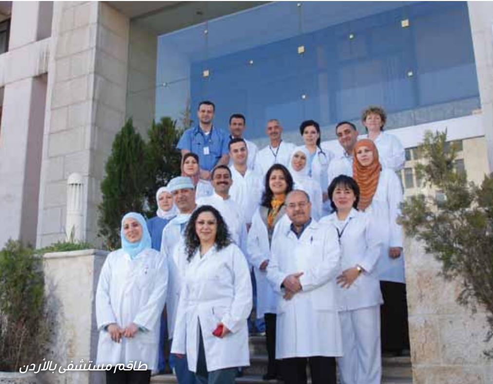
طاقم مستشفى بالأردن