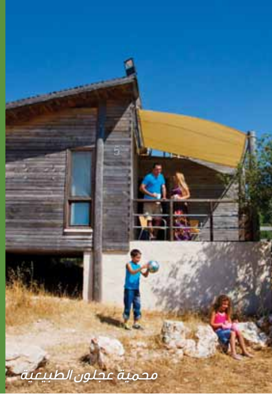
محمية عجلون الطبيعية