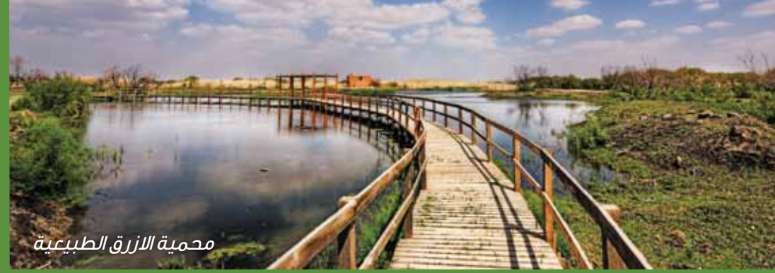
محمية الأزرق الطبيعية

تعدّ محمية الأزرق واحة متميزة في قلب الصحراء الأردنية الشرقية، حيث تقف فيها الطيور في كل عام في طريق هجرتها بين آسيا وأفريقيا. وبعضها يبقى حتى الشتاء أو تتكاثر ضمن المناطق المحمية من الواحة. كما يوجد في الأزرق العديد من البرك الطبيعية وأخرى بنيت في عصور قديمة، كما يوجد فيها مستنقعات تفيض بشكل موسمي، بالإضافة إلى سبخة طينية تعرف بقاع الأزرق.