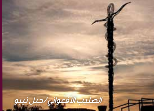
الصليب الأفغواني/جبل نيبو