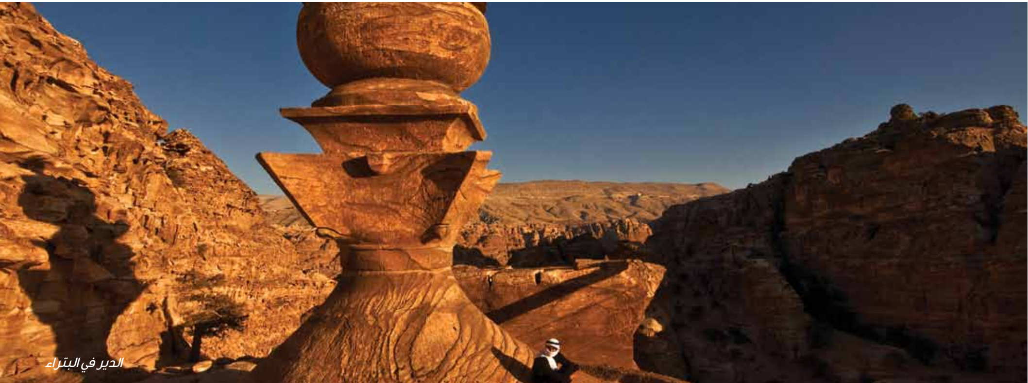
الدير في البتراء