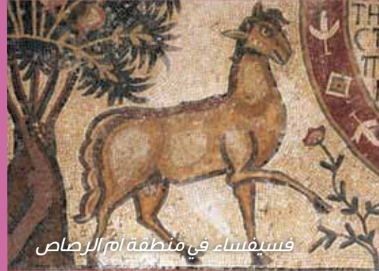
فسيفساء في منطقة أم الرصاص