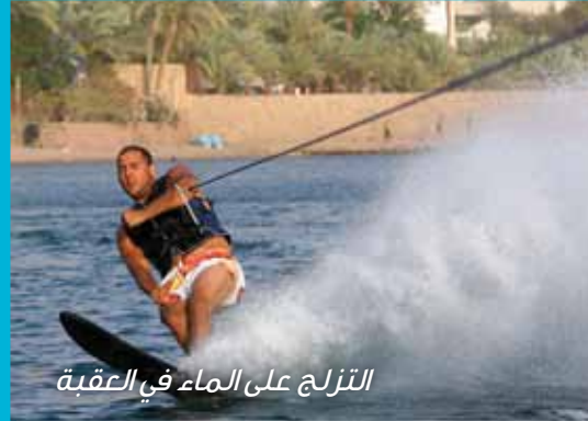
التزلج على الماء في العقبة