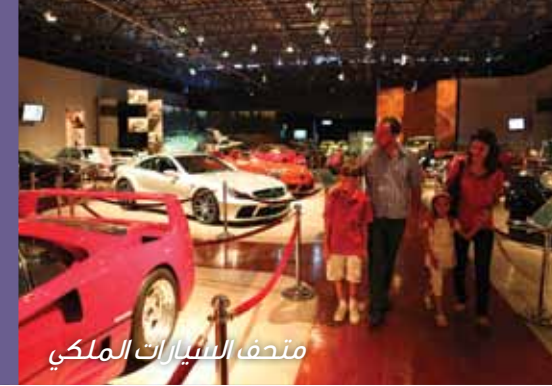
متحف السيارات الملكي