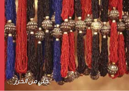
حلي من الحرز