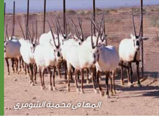
المها في محمية الشومري

قامت الجمعية الملكية لحماية الطبيعة بإنشاء محمية الشومري لتكون مركزاً لتكاثر بعض الحيوانات المهددة بالانقراض أو التي انقرضت في الأردن، مثل المها، والنعام، والغزال، والأخدر (الحمار البري)، حيث تم توفير بيئة مناسبة للحيوانات في هذه المحمية، وتعتبر مكان مثالي للزيارة من قبل العائلات.