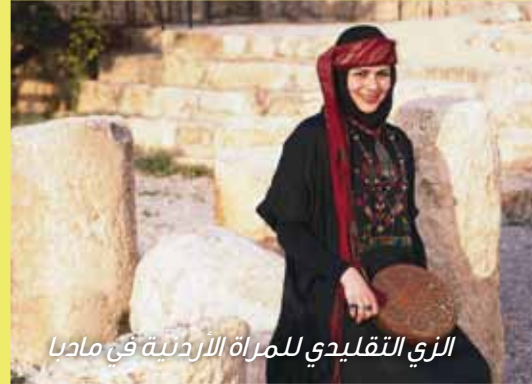
الزبي التقليدي للمرأة الأردنية في مادبا