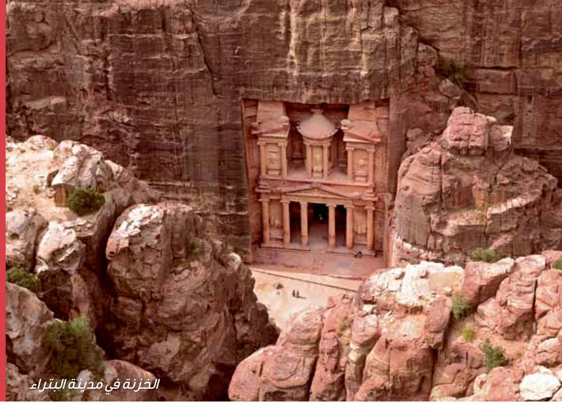
الخنزة في مدينة البتراء

وفي القرن الرابع عشر الميلادي، كانت البتراء منسية في الغرب، وبقيت طلي النسيان لمدة ٣٠٠ عام تقريباً، إلى أن جاء العام ١٨١٢، عندما أُنقح الرحالة السويسري جوهان لودفيج بوركهارت، الدليل الذي كان معه بأن يأخذه إلى المدينة الضائعة المزعومة. وكتب في ملاحظاته التي كان يكتبها دون أن يلحظه أحد «يبدو لي أن هذه الآثار في وادي موسى هي آثار البتراء القديمة.»