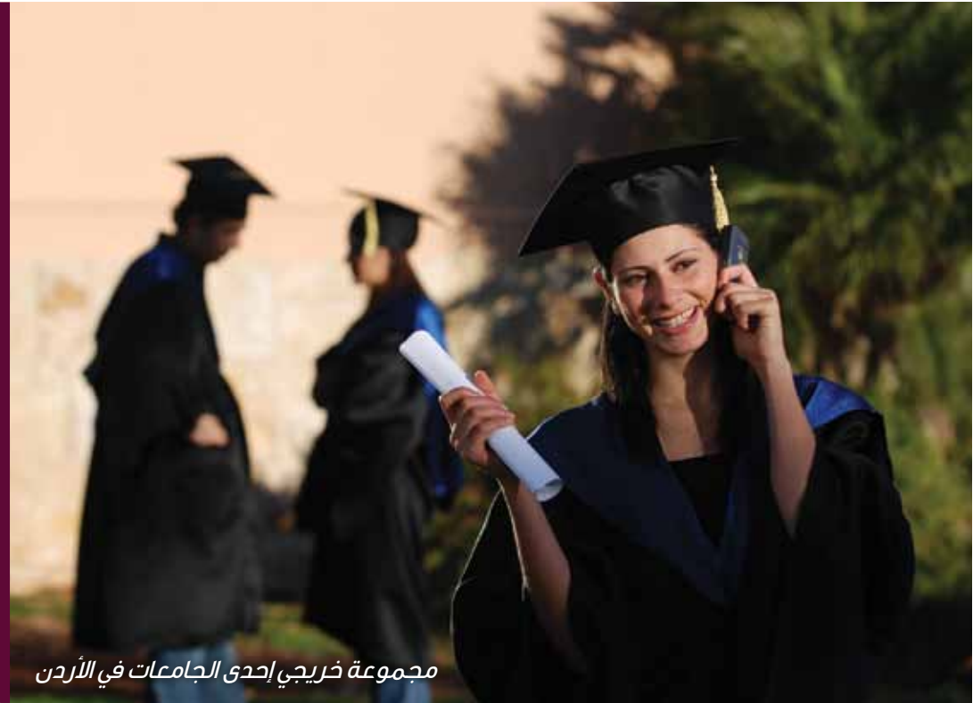
مجموعة خريجي إحدى الجامعات في الأردن

يمتلك الأردن شبكة طبية متقدمة تابعة للقطاعين الحكومي والخاص، وتمتاز الخدمات الطبية المقدمة في الأردن بحدثة المستشفيات والمراكز الطبية، ووجود عدد من اهم الاختصاصيين في العالم في معالجة كافة الأمراض، كالسرطان، وأمراض القلب، وأمراض العيون، وطب الأسرة، والعقم وغيرها.