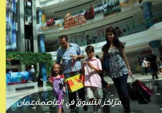
مراكز التسوق في العاصمة عمان