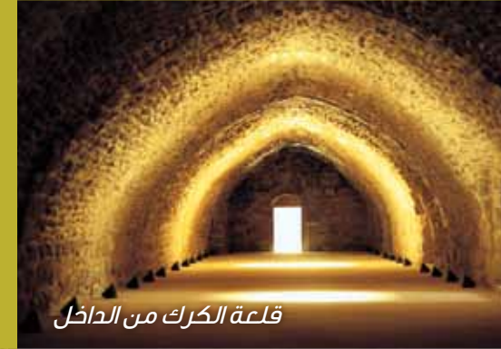
قلعة الكرك من الداخل