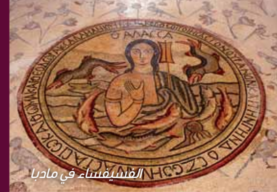
الفسيفساء في مادبا