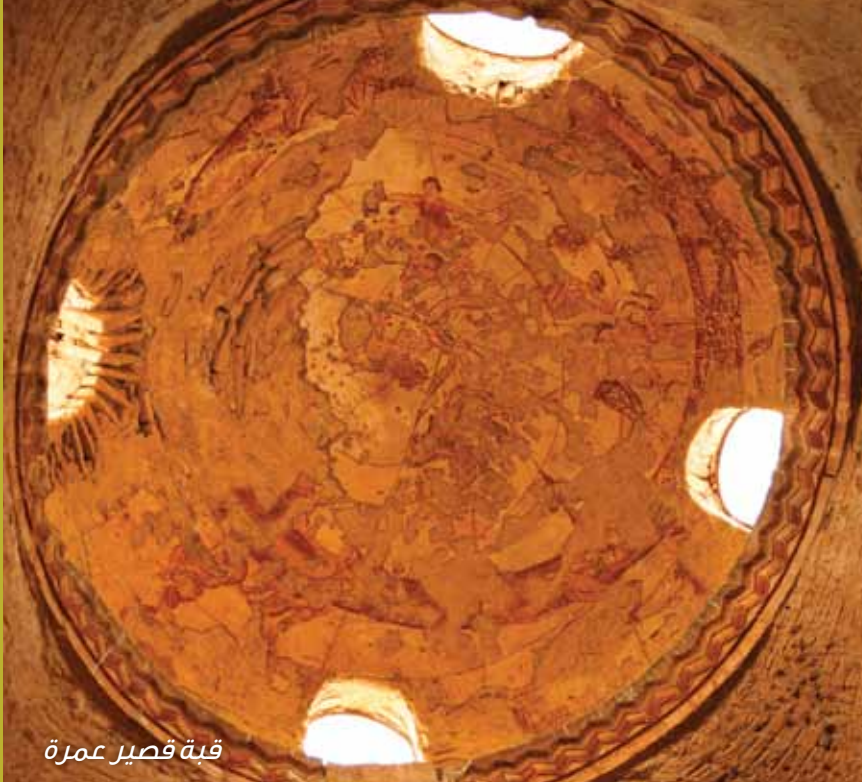
قبة قصير عمرة

تقع معظم القاعات والممرات في الكرك والتي حافظت على شكلها تقريباً حتى الآن في أماكن تحت الأرض ولا يمكن الدخول إليها إلا عبر بوابة كبيرة، ويمكنك الاستفسار عن ذلك عند مكتب التذاكر، فقد كانت مدينة الكرك عاصمة المؤابيين القديمة، وكانت تعرف في زمان الرومان باسم «كركموبا».