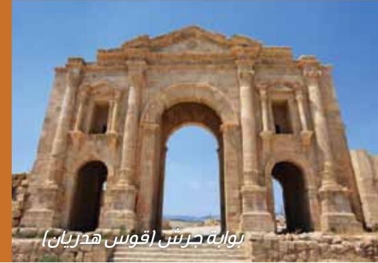
بوابة جرش (قوس هديران)