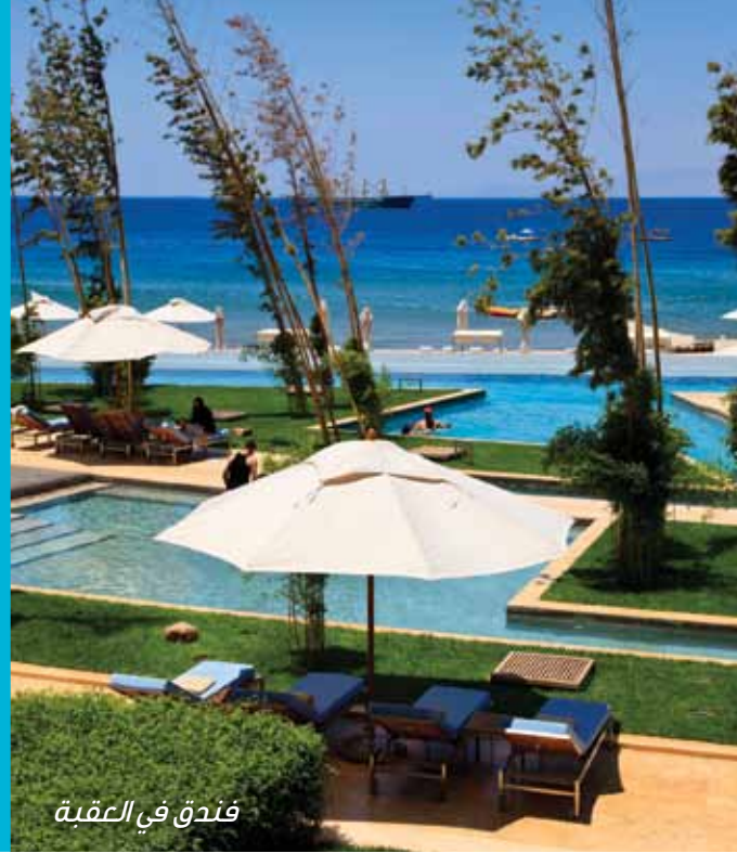
فندق في العقبة