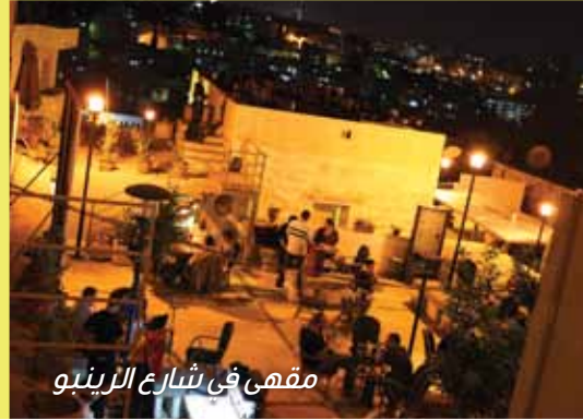
مقهى في شارع الزينبو