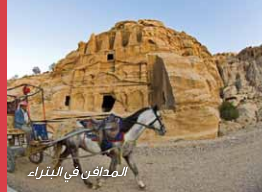
المدافن في البتراء