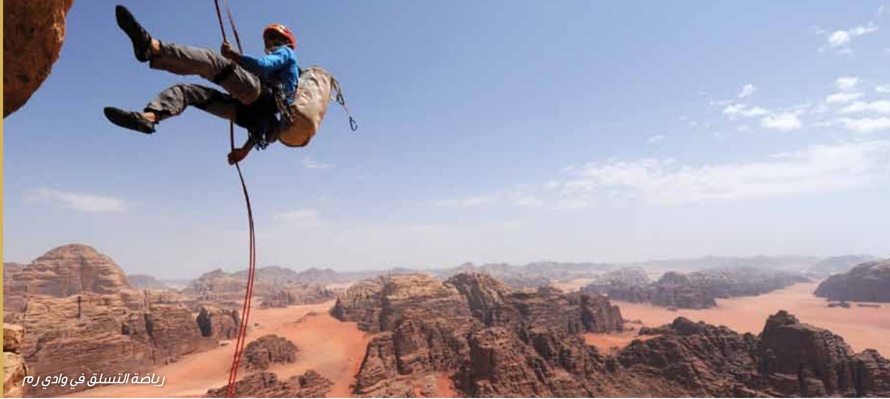
رياضة التسلق في وادي رم

أن معظم مشاهد الفيلم الكلاسيكي «لورنس العرب» الذي أخرجه ديفيد لين عام ١٩٦٢، ومثل فيه بيتر أوتول وأليس جينيس وعمر الشريف كانت قد صور في وادي رم.